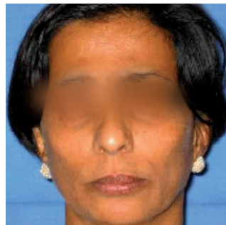
PHOTO-RÉJUVENATION